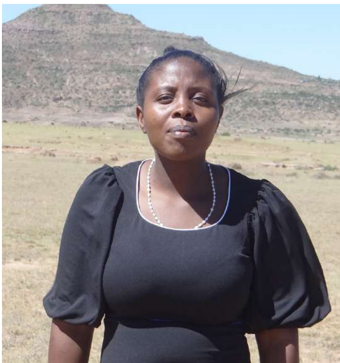
'Muelli le Motsamaisi oa Manane oa LNDB Nteboheleng Tanetsi.