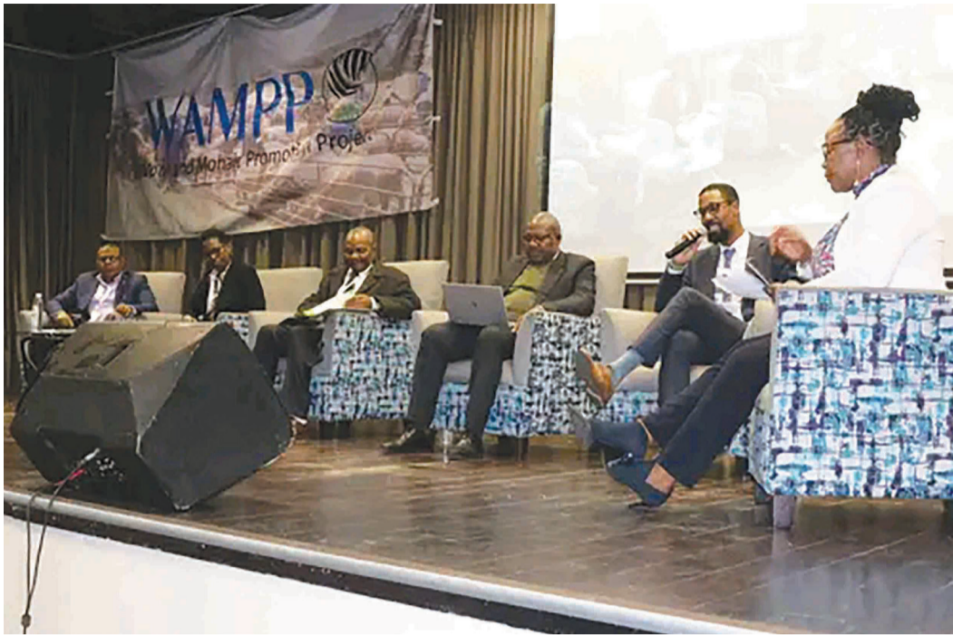
Litsibi tse bileng le seabo litabeng tsa paballo ea makhulo.