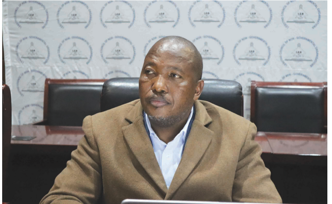
Mongoli-Kakaretso oa LAT Letsatsi Ntsibolane.

kenngoa tšebetsong ho ne ho sa lokisoa litichere hore li tsebe ho fetisa thuto hantle, empa ba eleletsoe hore