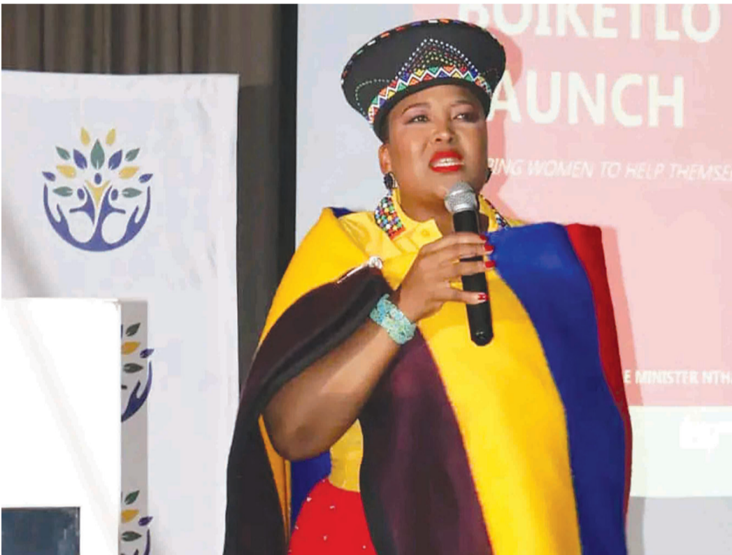
Letona la Likhokahanyo Mahlale, tšebeliso ea Mahlale le Boqapi, Nthati Moorosi.